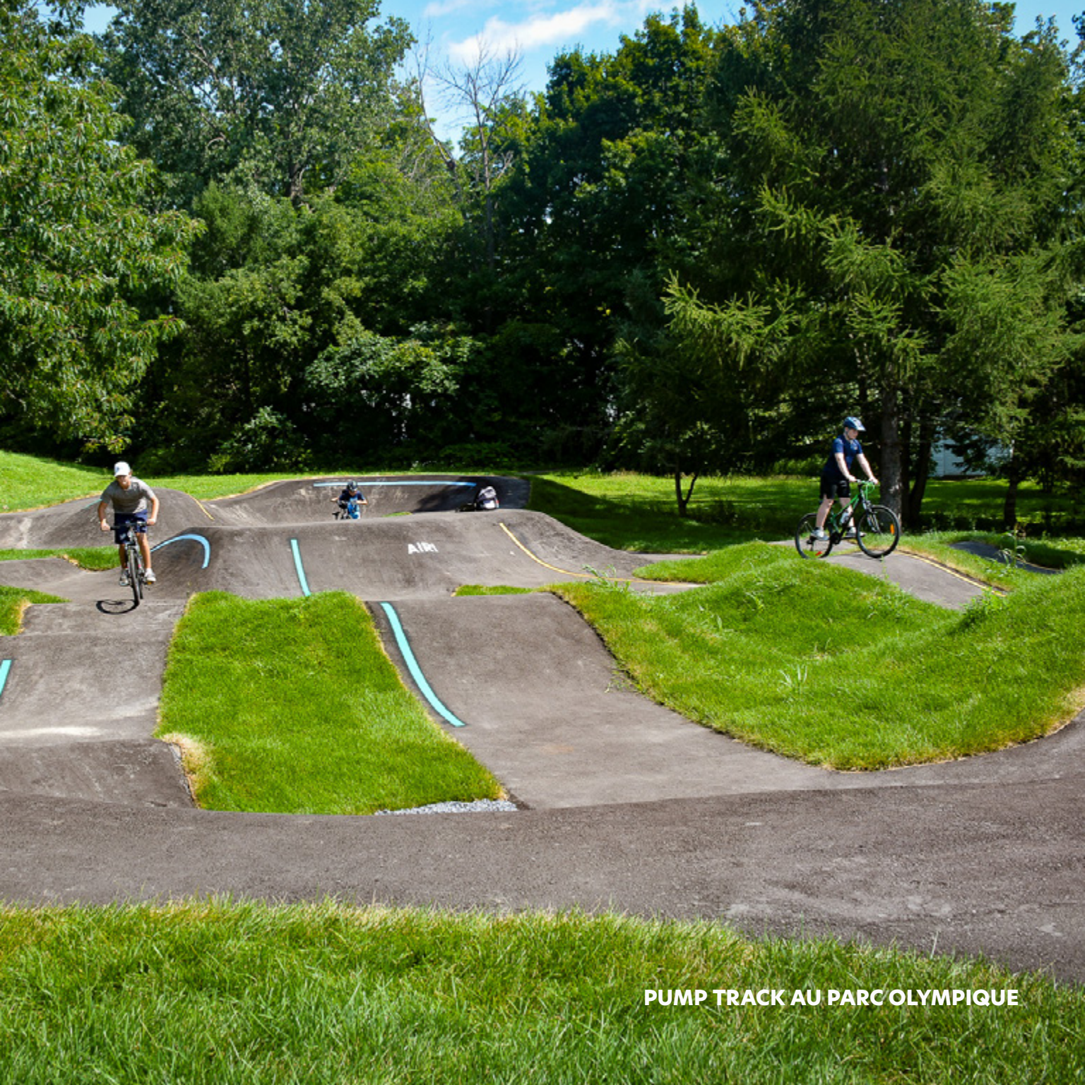
PUMP TRACK AU PARC OLYMPIQUE