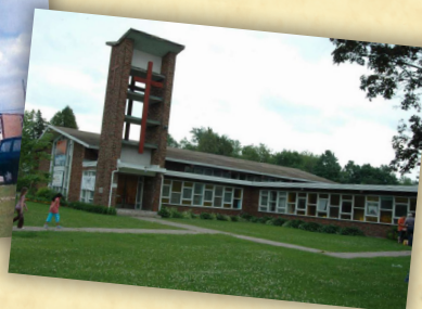
Photos de gauche à droite: Église Notre-Dame-de-Lorette • Boulevard Cardinal-Léger • École Notre-Dame-de-Lorette en 1964 • Presbyterian Church of Ile Perrot