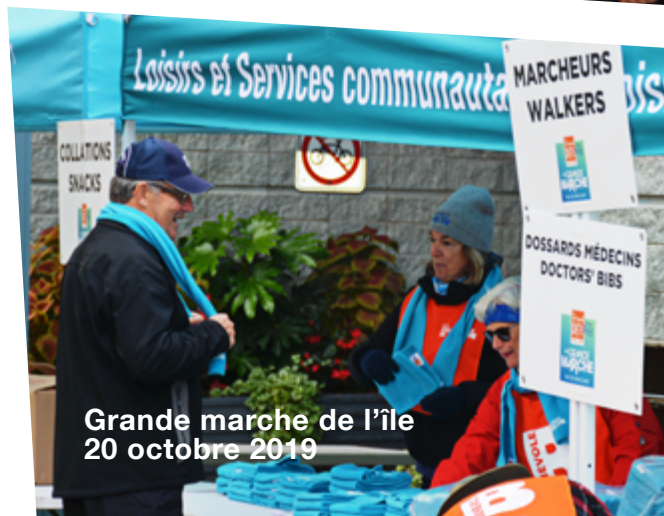
Grande marche de l'île 20 octobre 2019