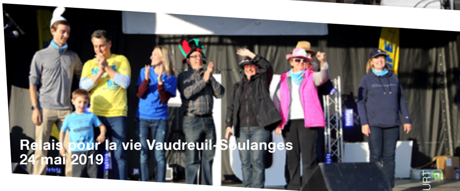
Relais pour la vie Vaudreuil-Soulanges 24 mai 2019