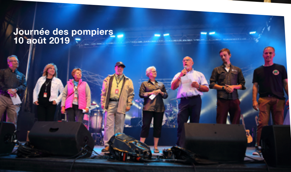
Journée des pompiers 10 août 2019