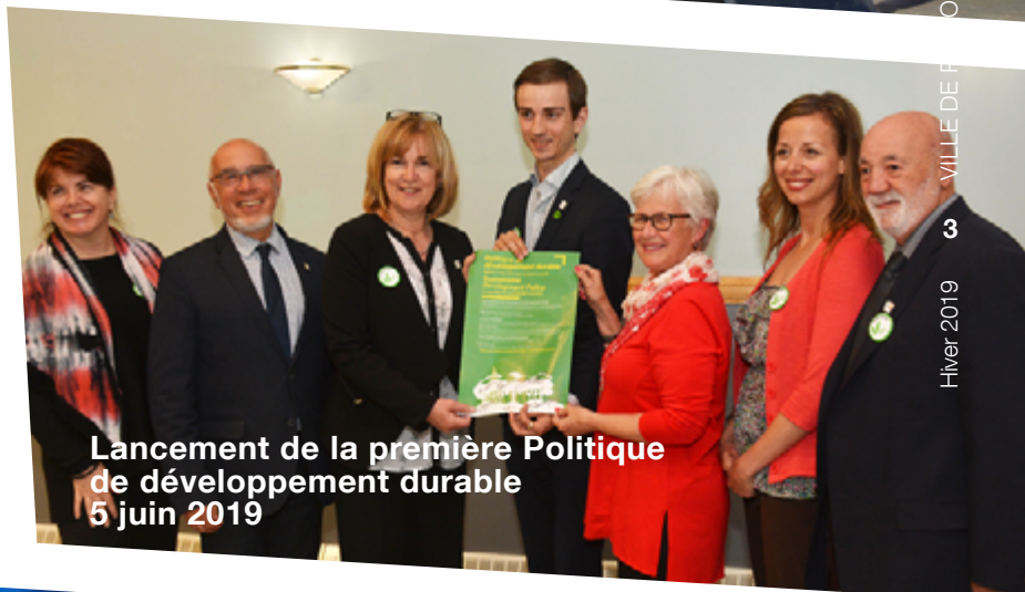
Lancement de la première Politique de développement durable 5 juin 2019