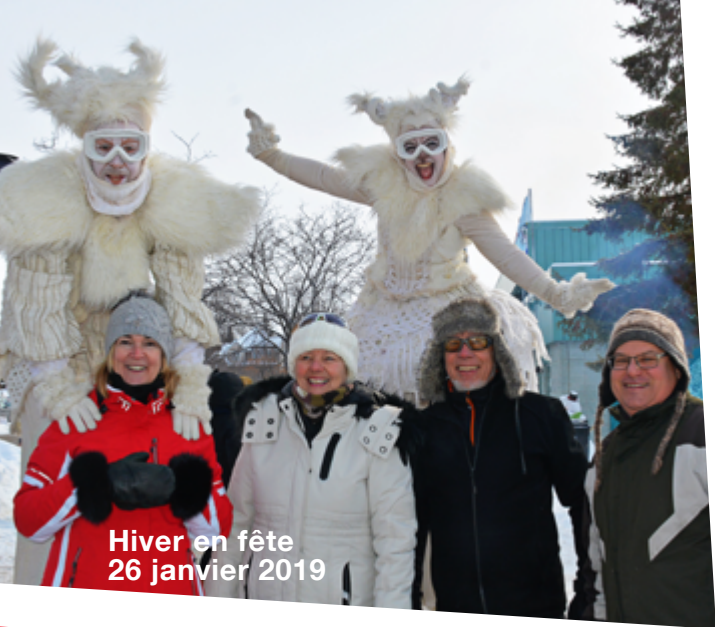
Hiver en fête 26 janvier 2019