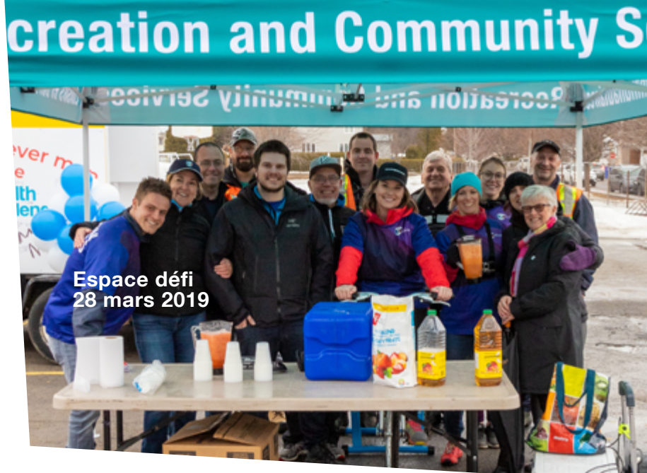
Espace défi 28 mars 2019