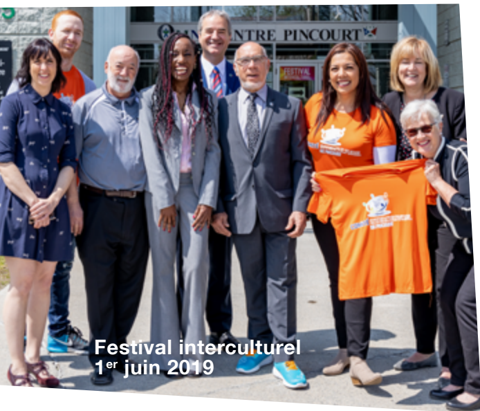
Festival interculturel 1 er juin 2019

Toujours disponible et à votre écoute, votre conseil municipal était présent aux différents événements organisés au courant de l'année.